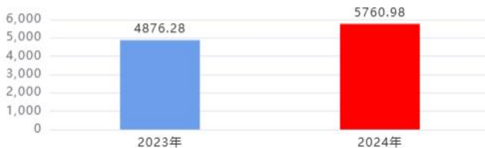
财政拨款收入、支出总计对比图（单位：万元）

2024年度财政拨款收入总计、支出总计均为5,760.98万元，与上年相比收入总计、支出总计均增加884.70万元，增长18.14%，增长的主要原因是：2024年度单位开展宝鸡市纪委“监务通”平台建设项目、宝鸡市纪委信息化建设项目、中共宝鸡市委巡察工作专项经费项目，项目支出增加。