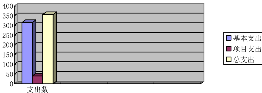
支出构成情况柱状图

2018 年度支出总计 355.95 万元，其中：基本支出 315.31 万元，是为保障机关正常运转、完成日常工作的各项支出，包括人员经费和公用经费，占总支出的 88.58%；项目支出 40.64 万元，是为完成专项工作任务，在基本预算支出之外，财政预算专项安排的支出及省民宗委专项业务补助经费，主要包括少数民族发展资金、团体专项业务费及宗教工作专项业务费，占总支出的 11.42%