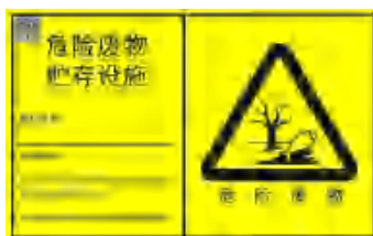
图 4-1 危险废物贮存设施标志

④危险废物贮存间要防晒、防风、防雨淋。贮存间和暂存危险废物的容器上必须粘贴符合《危险废物识别标志设置技术规范》（HJ1276-2022）所示的标志，见图4-1。