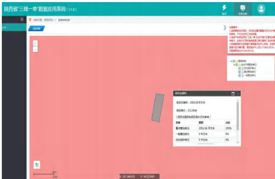
图 1-1 项目“陕西省‘三线一单’数据应用系统 V1.0 查询结果”示意图

项目通过陕西省“三线一单”数据应用分析平台（V1.0）冲突分析，形成对照分析示意图 1-1，由图可知项目建设范围全部位于生态环境管控的重点管控单元。