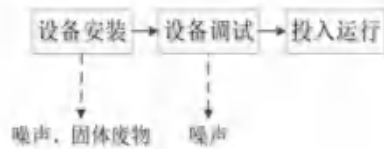
图 2-2 施工期工艺流程及产污环节图

项目租赁宝鸡市新博腾金属材料有限公司已建成标准厂房，经现场勘探，项目无大规模土建施工，只是部分设备安装、调试，施工工艺流程较为简单，产污环节为设备安装产生的运输扬尘、噪声、废包装材料，安装人员产生的生活垃圾、生活废水等，项目施工期工艺流程及产污环节见图 2-2 所示。