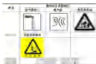
图 5-1 环境保护图形标志

在厂区的废气排放口、噪声排放源、固体废物贮存处置场应设置环境保护图形标志，结合项目实际污染物排放特点，环境保护图形标志见图 5-1。