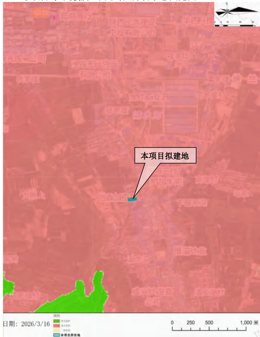
图 1-1 本项目与环境管控单元对照分析示意图