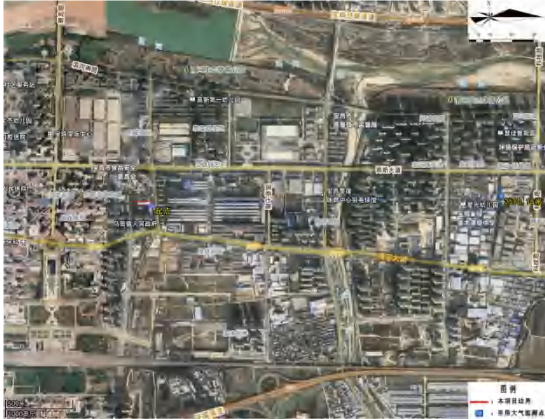
图 3-1 TSP 引用数据监测点位示意图

由表 3-2 可以看出：本项目所在区域监测因子 TSP 24h 平均监测值符合《环境空气质量标准》（GB 3095-2026）二级标准要求。